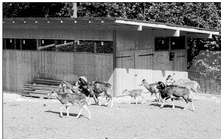
In diesem Häuschen richtet Emil Plaschy Koppeln für die verletzten Tiere ein.